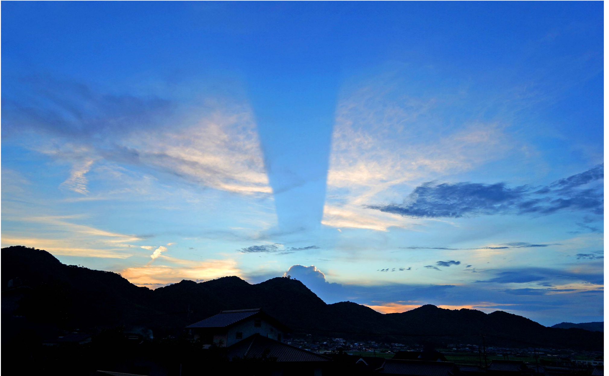
8.12の夕焼け。西の空に青い十字架が現れたようだった。 ぼくがいわく、Save the Earth