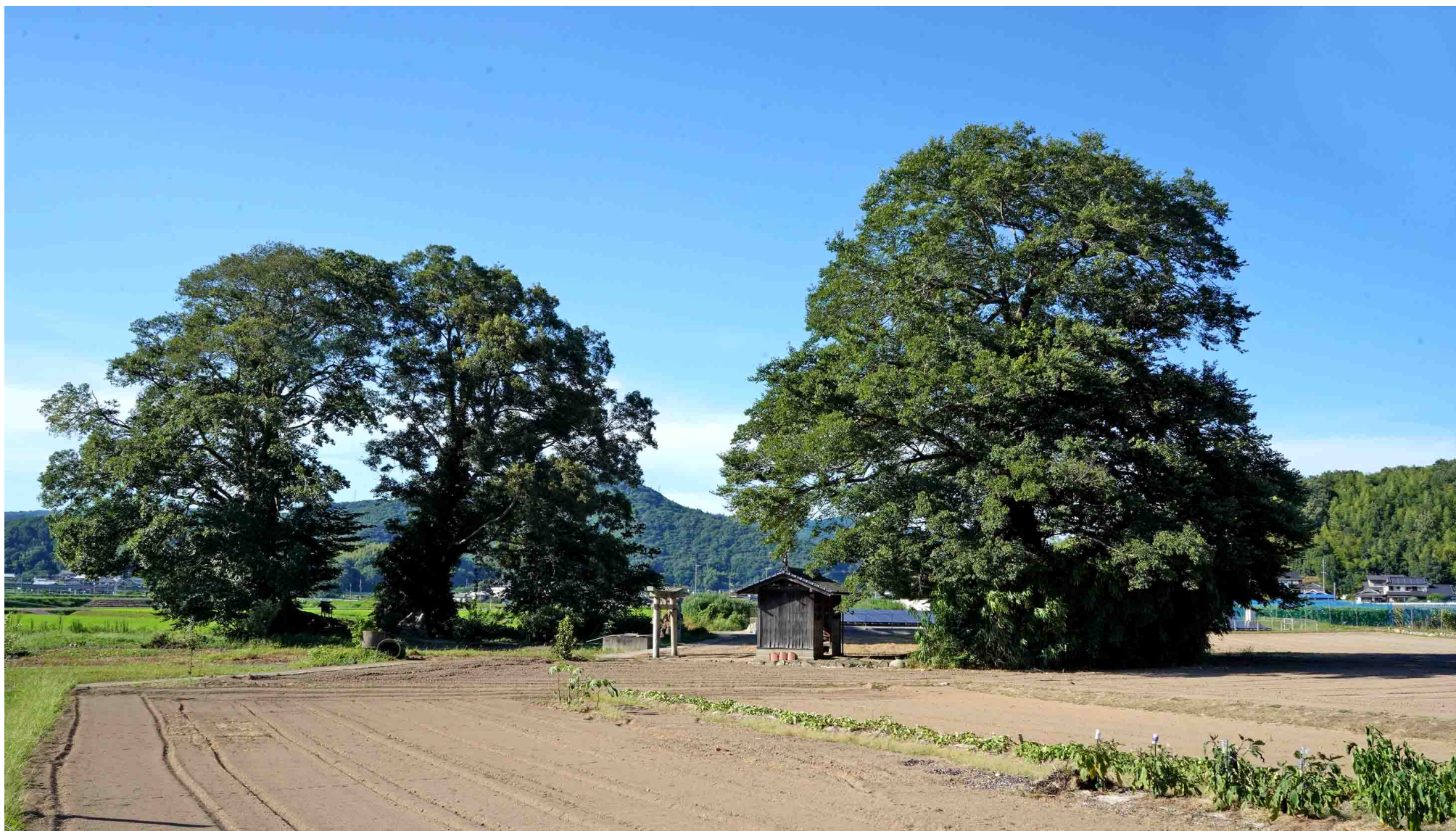
真夏の8.12。自転車であたりを見回りに出た。 田んぼの一面に樹齢400年のムクの木と榎木が仲良くならんでいる。 それぞれの巨木の下に2つの神社が有り、2つの鳥居が向き合っている。 上下稲荷と言う。