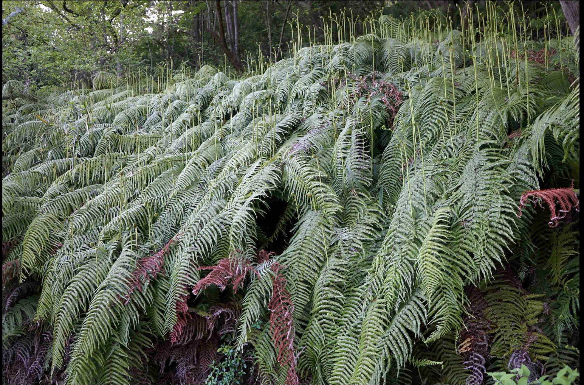
ウラジロの新芽が一斉に伸び出している。成長という言葉がそのままそこに置かれているみたい。